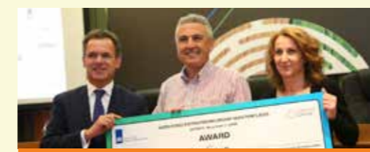
AgriBusiness Forum: Adopt the Triple Helix approach

Έτσι απλά. Γιατί η φροντίδα είναι ένας κύκλος, χωρίς αρχή και τέλος. Ο Κύκλος της δικής μας Φροντίδας.