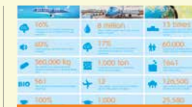
KLM takes steps in Sustainable Flights