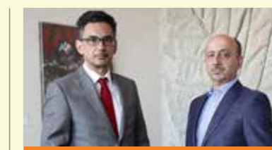
INTERAMERICAN Sustainable Development Report